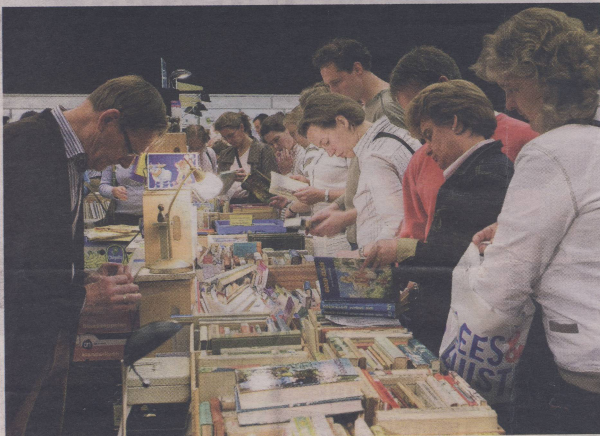
Er viel volop te snuffelen en te struinen tussen de christelijke boeken en muziek.